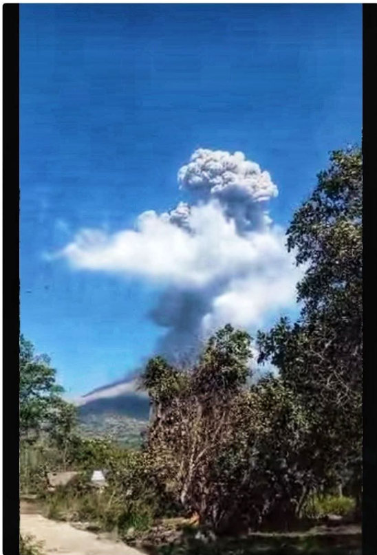
De uitbarsting van Lewotobi op 27 september 2025