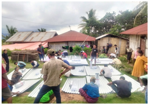
Dakreparaties bij vorige uitbarstingen.