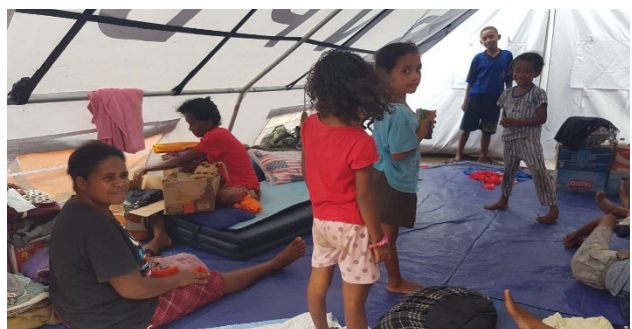
Kinderen in een opvangkamp.