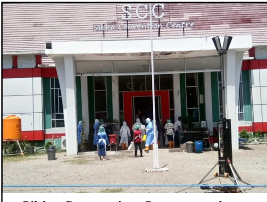
Sikka Convention Center used as a place of isolation

De wereld is momenteel in rouw als gevolg van de wereldwijde ramp die zich heeft voorgedaan, veroorzaakt door het coronavirus. Bijna alle landen zijn besmet met dit virus, zowel ontwikkelde landen, ontwikkelingslanden en arme landen. De effecten als gevolg van deze pandemie omvatten een daling van de wereldeconomie, toenemende sociale problemen, zoals de toegenomen werkloosheid omdat veel bedrijven moeten sluiten, afnemende voorraad van geneesmiddelen en persoonlijke beschermingsmiddelen in ziekenhuizen en apotheken, veel honger in gezinnen vanwege het wegvallen van inkomen, terwijl de prijzen van levensmiddelen en andere ingrediënten op de markt enorm in prijs stijgen, problemen met internet waardoor het online systeem (thuis werken, thuis bidden en thuis studeren) en nog veel meer andere die nog meer beangstigend lijken, en soms zelfs tot doden leiden.